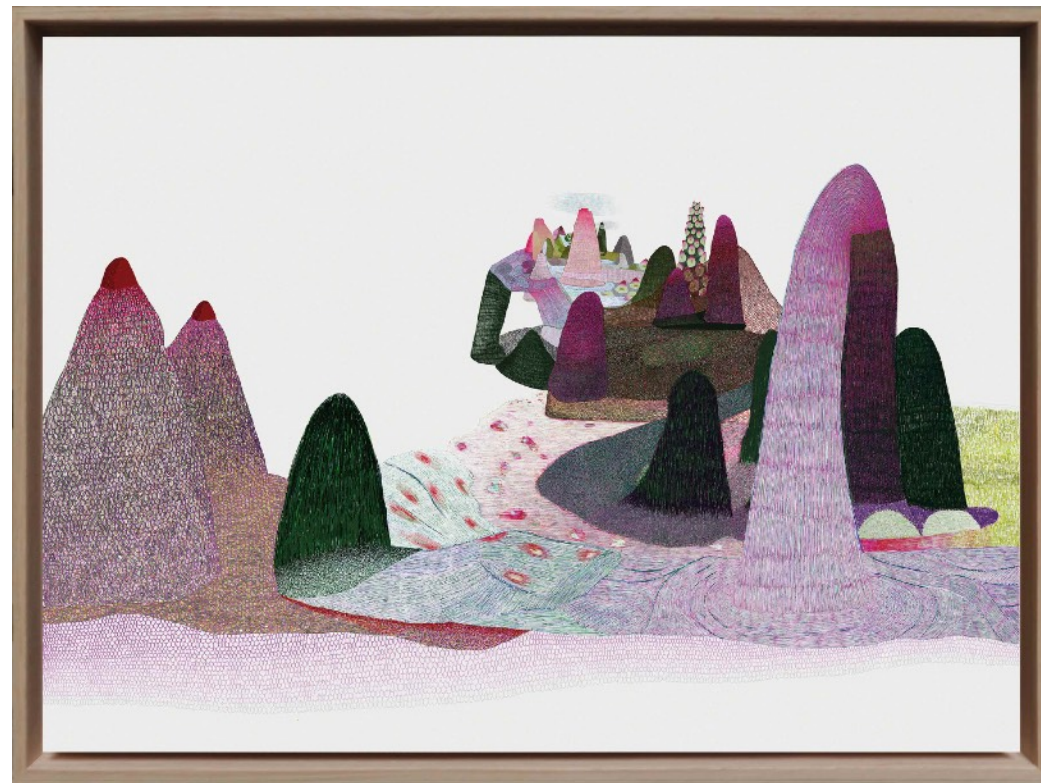
Biostasie 23 , impression jet d'encre sur papier Museum Canson 315 g/m 2 contrecollé sur aluminium, 55 x 73 cm, 2021