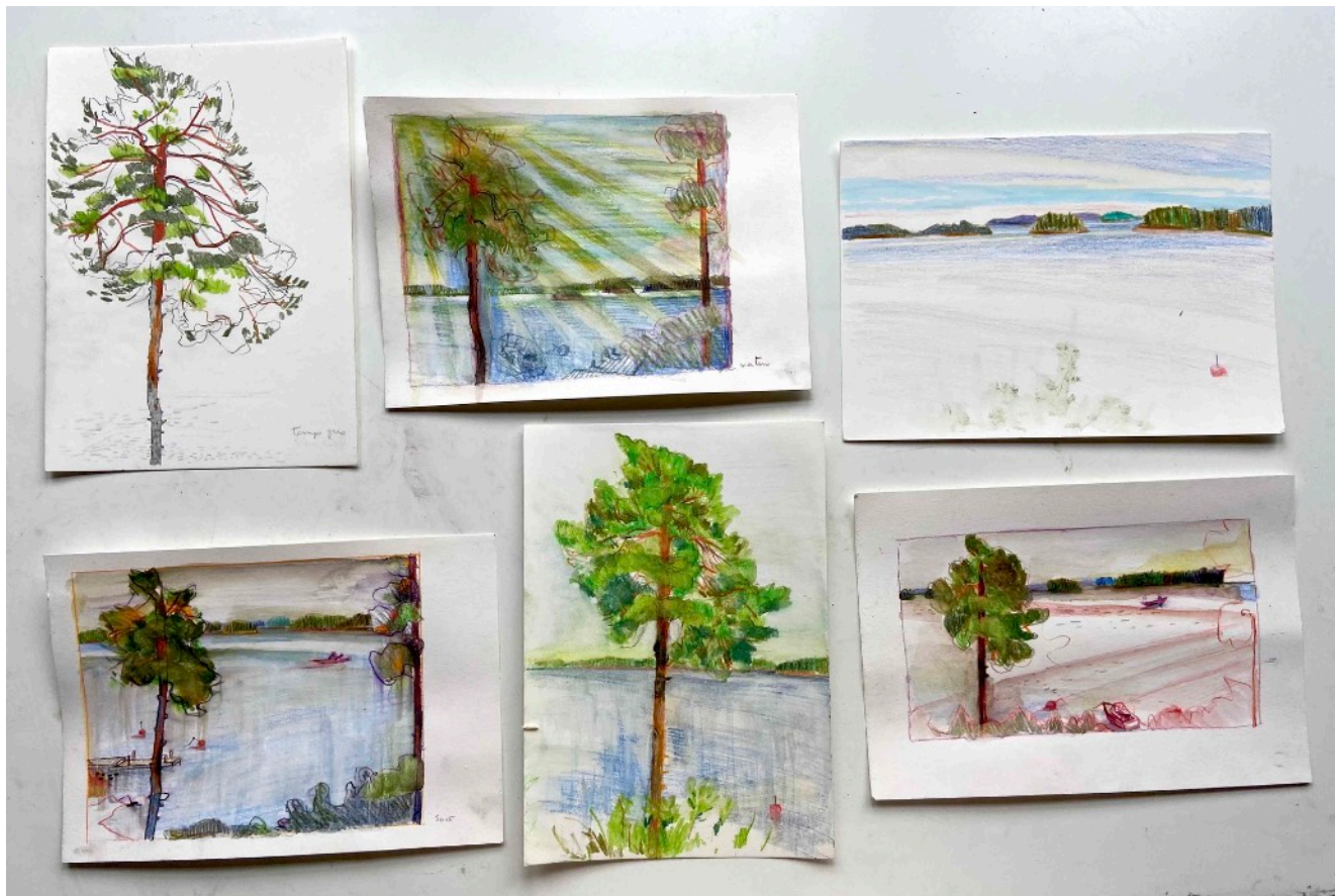
Yxlan, dessins préparatoires, 2022