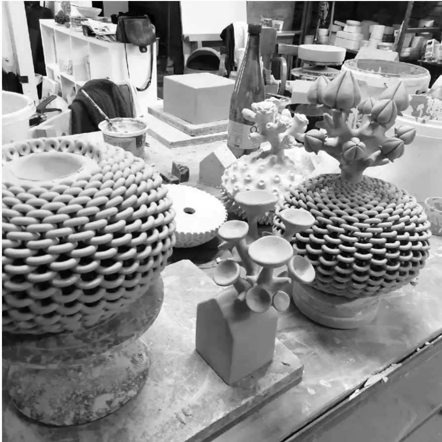
Pièces en cours à l'atelier