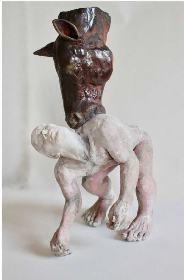
Danseur butoh avec tête de cheval, grès, 47 x 29 x 16,5 cm, 2022