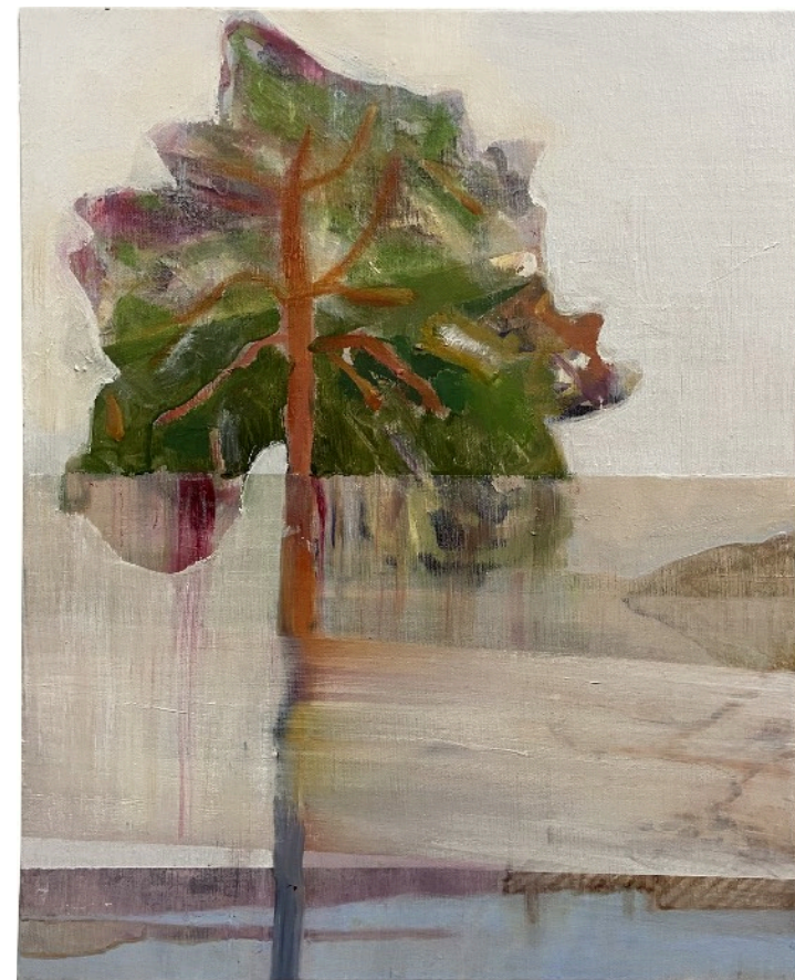
Temps blanc, 40 x 50 cm, huile sur toile, 2022