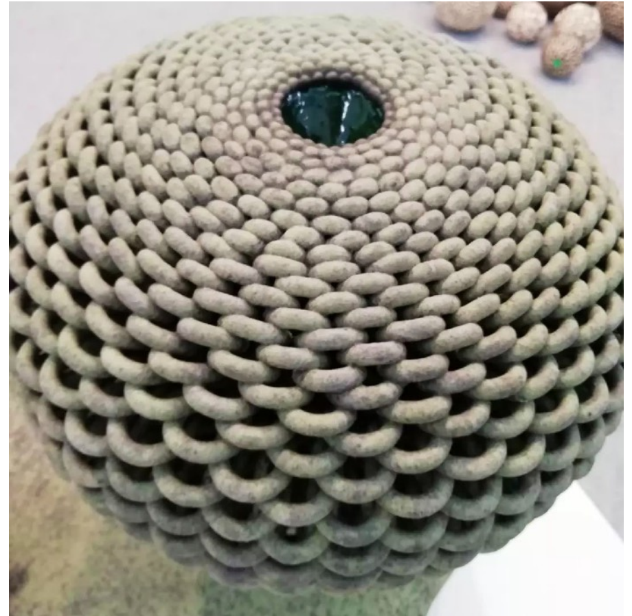
Détail d'une pièce