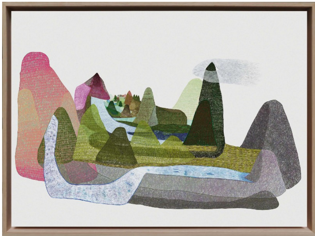
Biostasie 13 , impression jet d'encre sur papier Museum Canson 315 g/m 2 contrecollé sur aluminium, 55 x 73 cm, 2021