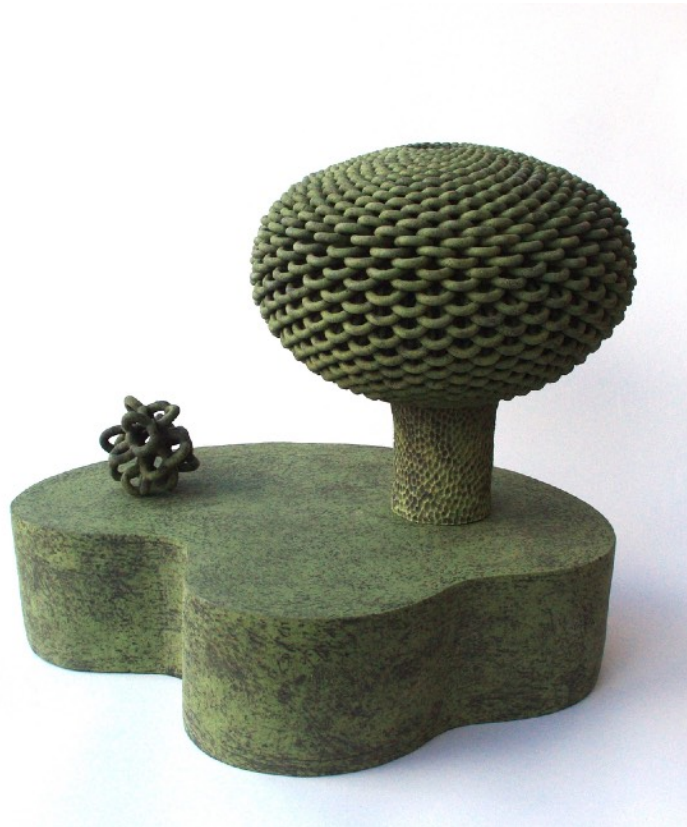
Trikota, faïence modelée, engobée, émaillée, 34 x 40 x 32 cm, 2021