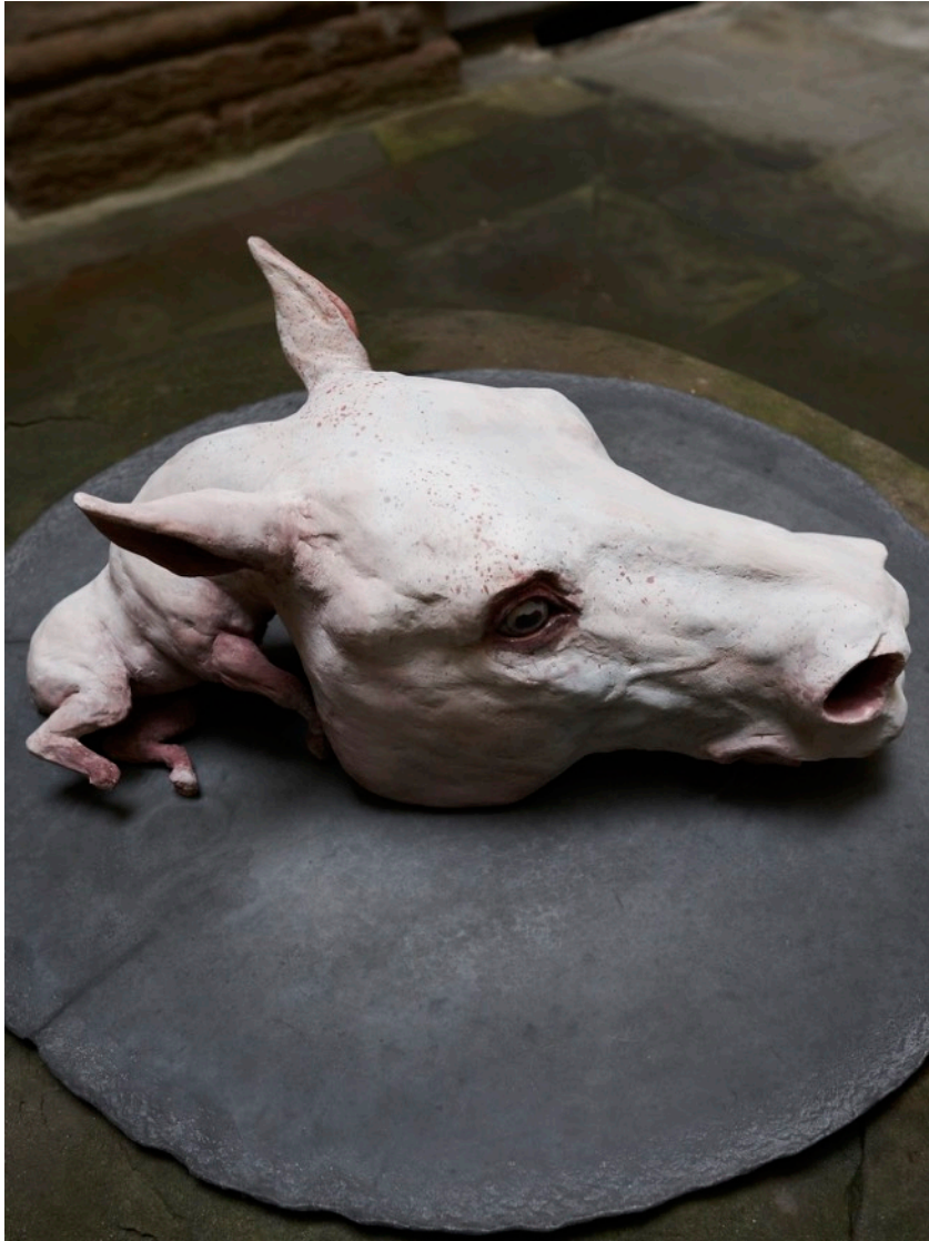
Chute de cheval , grès, 30 x 63 x 27 cm, 2021