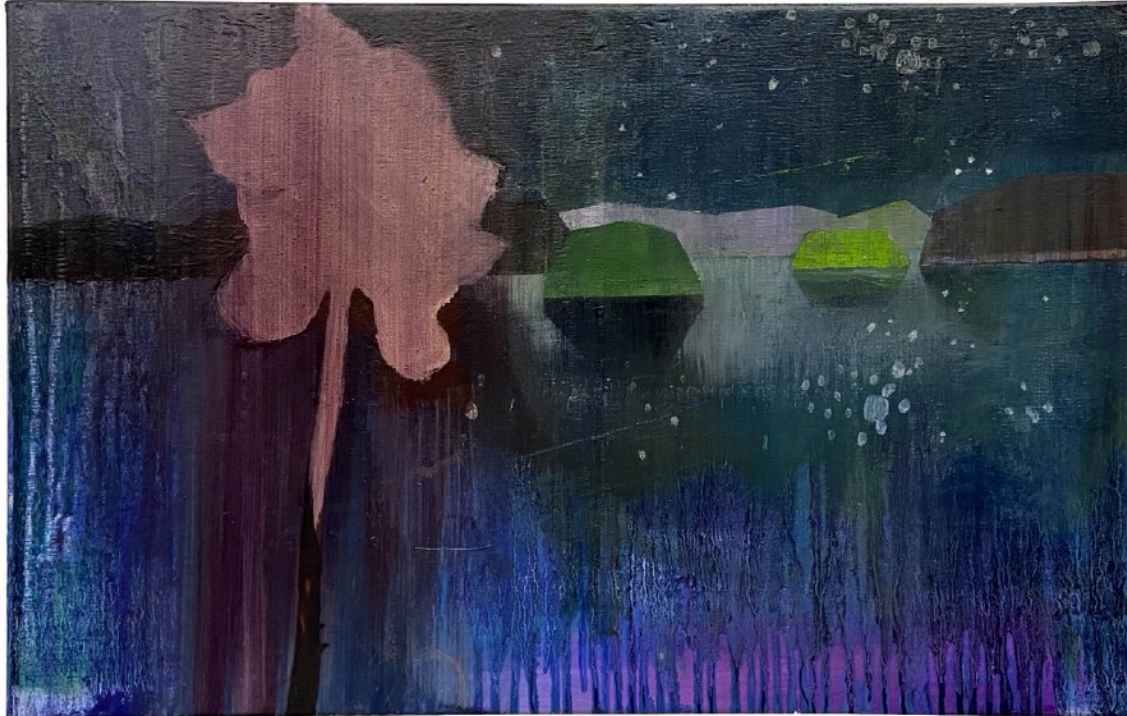
Yxlan by night, 38x60 cm, huile sur toile, 2022

Ces derniers mois, la peintre a sillonné différents chemins ; ceux de l'île de Yxlan (de l'archipel de Stockholm), de Compostelle, ou encore celui qui la mène jusqu'à son atelier d'Ascain depuis sa maison à Halsou. Au moment du lever ou du coucher du soleil, elle les a foulés, plusieurs fois, relevant lumières, sensations et couleurs.