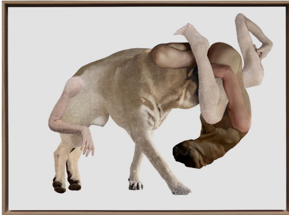
Transgénose 21 , impression jet d'encre sur papier Museum Canson 315 g/m 2 contrecollé sur aluminium, 75 x 100 cm, 2022

Les dessins numériques d'Emmanuel Lesgourgues