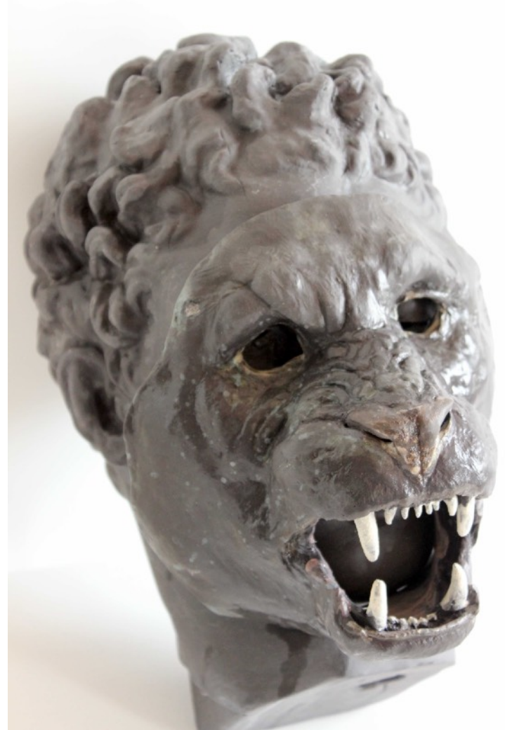
Masque félin sur tête d'Hermès , 18 x 11 x 17,5 cm, porcelaine, 2022